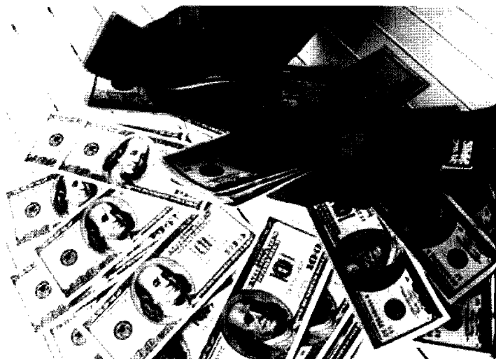
Nhiều ngân hàng trung ương đang giảm bớt lượng đô la Mỹ dự trữ trong ngân quỹ của mình để phòng tránh rủi ro.