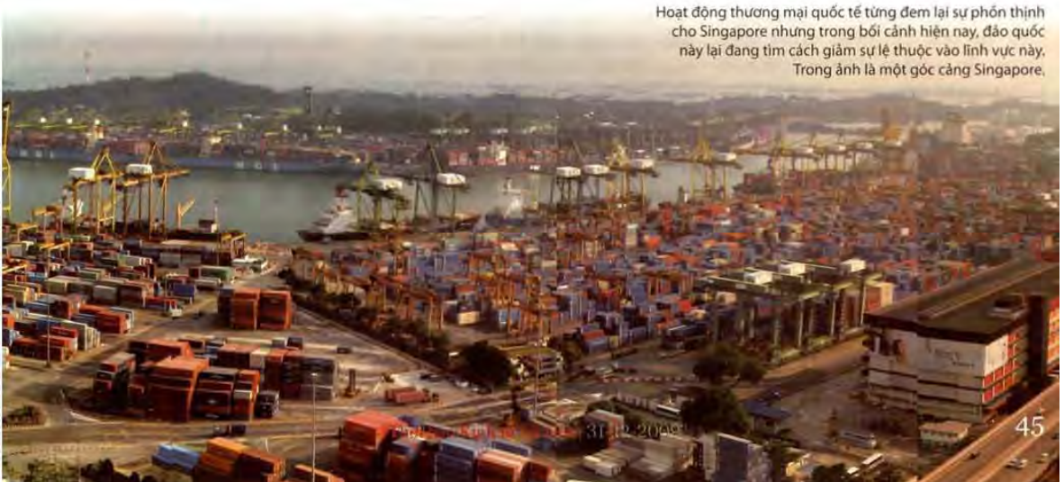
Hoạt động thương mại quốc tế từng đem lại sự phồn thịnh cho Singapore nhưng trong bối cảnh hiện nay, đảo quốc này lại đang tìm cách giảm sự lệ thuộc vào lĩnh vực này. Trong ảnh là một góc cảng Singapore.

Từ Singapore nhìn về Việt Nam, với hoạt động thương mại ngày càng là trụ cột quan trọng của cấu trúc kinh tế, với tình trạng nhập siêu liên tục và mức dự trữ ngoại tệ thấp trong một bối cảnh mậu dịch toàn cầu đang suy giảm, việc lèo lái con thuyền kinh tế đất nước là một thách thức lớn cho chúng ta trong những tháng ngày sắp tới! ■